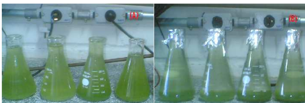
Figura 2. Amostra coletada logo após a eletrólise e após um tempo de sedimentação.

Após a realização dos experimentos as amostras foram conduzidas para erlenmeyers e destinadas a filtração para determinação de massa. Vale lembrar que, devido às pequenas dimensões das microalgas, as células se não floculadas não são retidas pelo meio filtrante em uma filtração, a não ser no caso de uma ultra-filtração. Na Fig. (2) observa-se uma amostra coletada.